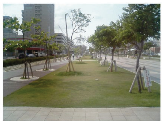
↑植樹完成から約2年経過