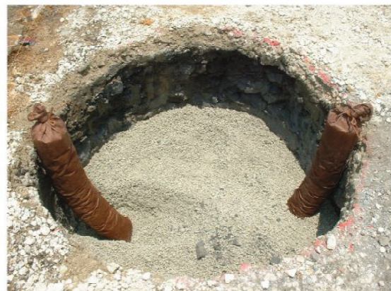
↑スーパーソルパイプ設置(1m)