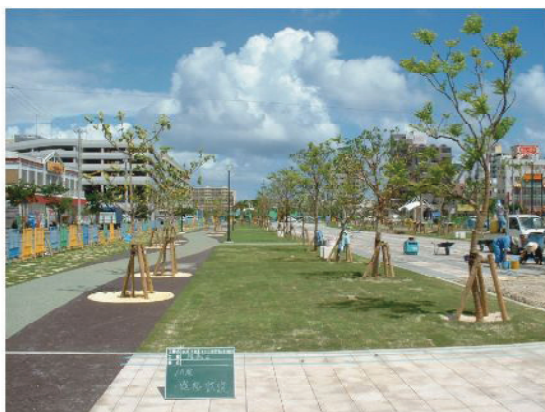
↑植樹完成(天久公園)