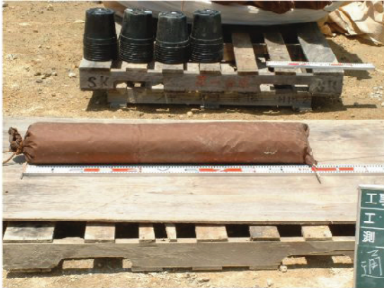
↑スーパーソルパイプ資材検収