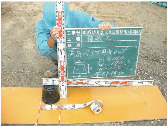
↑スーパーソルパイプキャップ資材検収